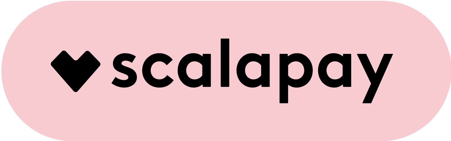
Para fines de impresión